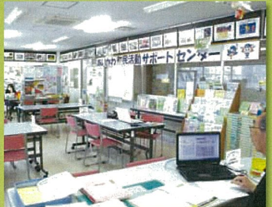
サポートセンター内の様子