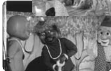
「親子で遊ぼう!」の様子