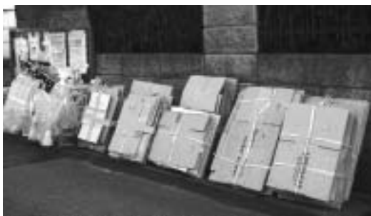
段ボールは必ず折り畳み、ビニールひもなどで十字に縛って出してください。