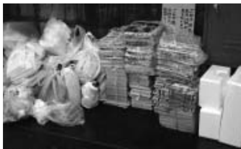
紙類を収集所に出す場合は、同じ種類や大きさに分別し、整理して出してください。