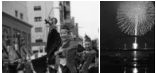
昨年のDANBEパレードと夜空を彩る1万発の花火大会

厚木の街が祭り一色に染まるこの時期、皆さんも友達や家族を誘ってお出掛けください。