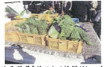
「地元野菜」採れたて新鮮だよ〜!