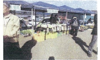
サア〜!いらっしやい!