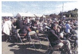
多くの皆様!ようこそお越しくださいました。ありがとうございます!