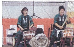
愛川高校和太鼓OB・OG「打縁」 力強いね〜!