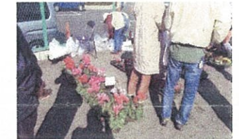
「愛川園芸」きれいなお花安いわ〜!