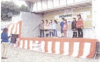
半原小学校「ホワイトエンジェルス」 天使の歌声ありがと〜!