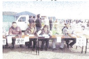
皆さんお疲れ様です!