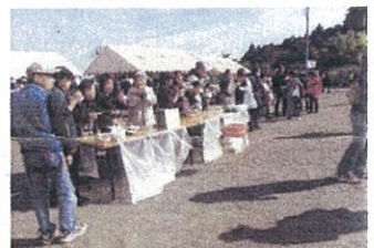
生演奏聞きながら食事、いいね〜!