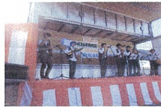
初参加です!「ケイナ演奏」