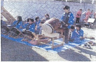
開会前、景気よく そ〜れ!