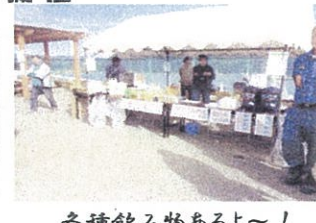
各種飲み物あるよ〜!