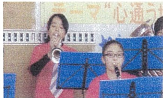
「愛川中学校吹奏楽部」 軽快なリズムいいね♪