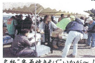
名物「半原焼きそば」いかが〜!