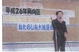
お招きいただきありがとうございます!