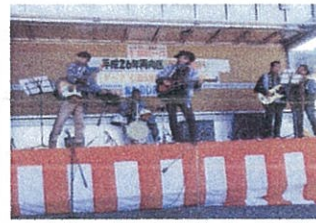
おなじみご当地「篠崎バンド」!