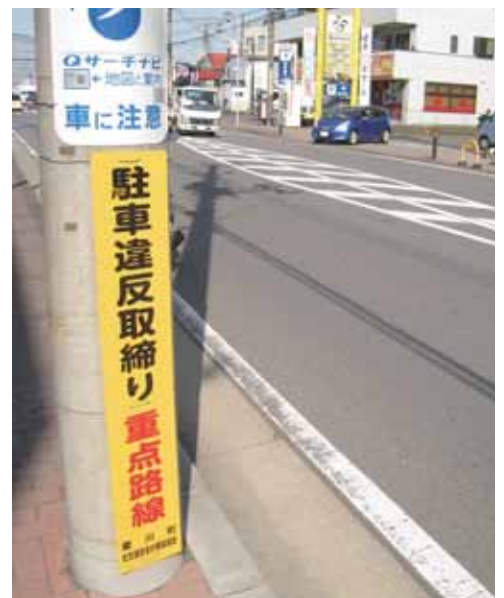
マルエツ中津店前の啓発看板

うために雑草火災対応計画を作成するなど、初動体制に万全を期しています。また、夜間に巡回警備を行い、火災予防に努めているほか、厚木警察署においても消防本部と連携し、現場付近のパトロールを実施しています。今後も、関係機関と連携を図りながら、火災の未然防止に努めていきたいと考えています。 〈その他の質問事項〉 役場庁舎裏広場の利用及び道路整備について