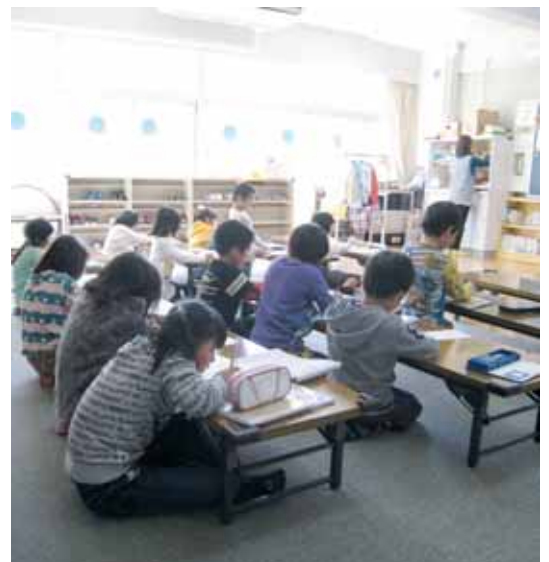
待機児童の解消へ向けた取り組みを

子育て支援課長 保育園に入所できない方は、「待機児童」と「入所保留児童」の区分に分けられます。保護者が求職活動をしていない場合や、育児休暇の取得期間中は待機児童として取り扱いはしていません。こうしたことから、国において待機児童の定義を実態に即した内容にすべく、現在見直しを進めている状況となっております。