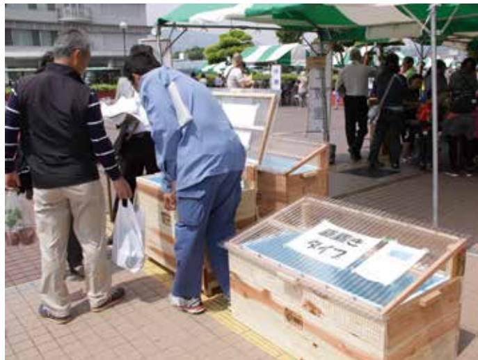
町のイベントでも積極的に愛川キエーロをPR

町長 平成28年度から新たに購入費補助を開始した生ごみ処理機愛川キエーロについて、さらなる普及を促進していきたくと考えています。子どもたちへの環境教育と町民皆さんの環境意識の向上を図るため、愛川キエーロを保育園や小学校、公