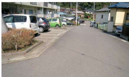
今回認定された道路（田代地内）

止 ◎町道路線の認定及び廃 道路法の規定により、 一部が一般交通の用に供 する必要がなくなった路 線や新たに町道として管 理する必要が生じた路線 について、町道路線の廃 止及び認定をするもので す。 今回は、田代地内1路 線の廃止及び田代地内、 坂本地内、細野地内、両 向地内4路線を新たに認 定しました。