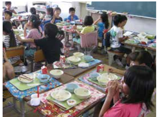
引き続き小中一貫教育推進事業を実施