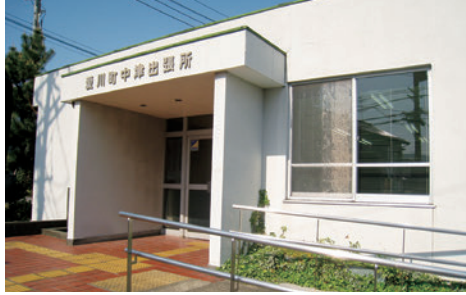
廃止される半原・中津出張所

「半原出張所」及び「中津出張所」については、経年による施設の老朽化が進み、今後の維持管理経費の増大が見込ま