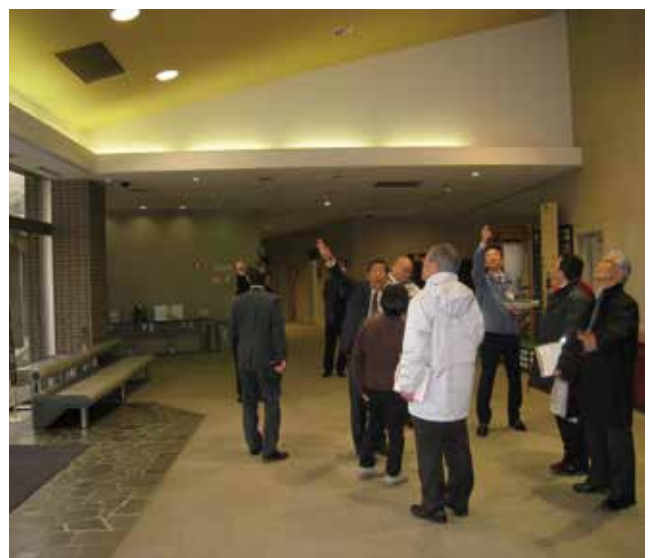
教育民生常任委員会で愛川聖苑を調査

答 自動車等の運転に不安を持つ高齢者が、自主的に運転免許証を返納しやすい環境を整備し、高齢運転者による交通事故の減少を図ることを目的として実施するものです。対象者は、本町に住所がある方で、運転免許証を平成29年4月1日以降、自主的に返納された75歳以上の方です。内容は、1人1回に限り高齢者バス