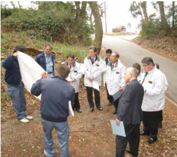
総務建設常任委員会で三増501号橋を調査

答 平成29年5月27日(土)の午後3時から、音楽を学んでいる高校生4名による演奏会を古民家山十郎で開催し、若者の文化艺术活動を支援するとともに、改めて、地域資源としての古民家山十郎の魅力を創造し、町内外に発信していくものです。 邸内では、演奏会にあわせて愛川ブランド認定茶菓を提供します。会場を訪れた方に、クラシック音楽を聴いたり、愛川ブランドを楽しむなど、古民家の雰囲気を楽しんだり、フレッシュな演奏会を味わっていただきたいと考えています。