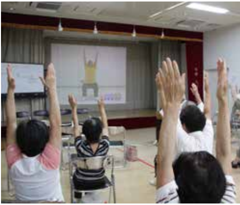
体操教室で健康づくりを推進

空き家対策では、空き家情報のデータベース化がされることを評価します。今後のデータの活用により空き家活用が図られることを期待します。