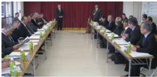
活発な意見交換が行われました