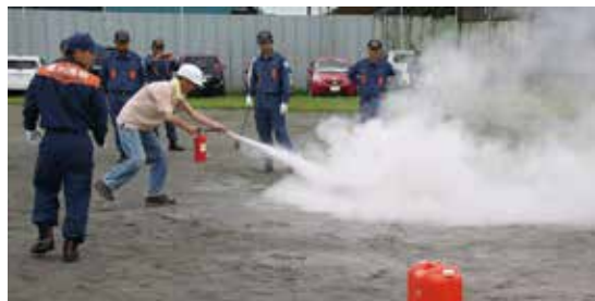
自主防災訓練のようす