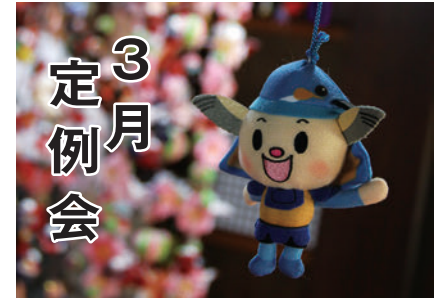
平成29年第1回3月定例会日程