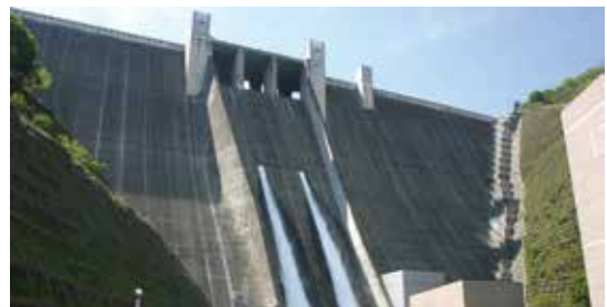
ナイト放流が本格実施される宮ヶ瀬ダム

問 マーケティング推進班を広報広聴班に統合する効果について伺います。 町長 これまでの広報広聴とシティプロモーション