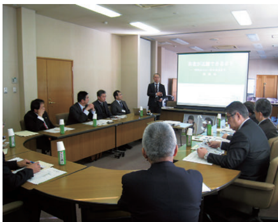
新城市で「若者議会」について視察

テーマを元に7つの分 科会を設置し、関係機関 などと議論を交わし、現 状の分析を行いました。 主な活動内容について は、ギネスに認定された 世界最長の木造人道橋で ある蓬萊橋にスポットを 当て、「おもてなし大作 戦事業」を実施するなど、 観光面でのPRを推進し ていく「観光分科会」な どがあります。