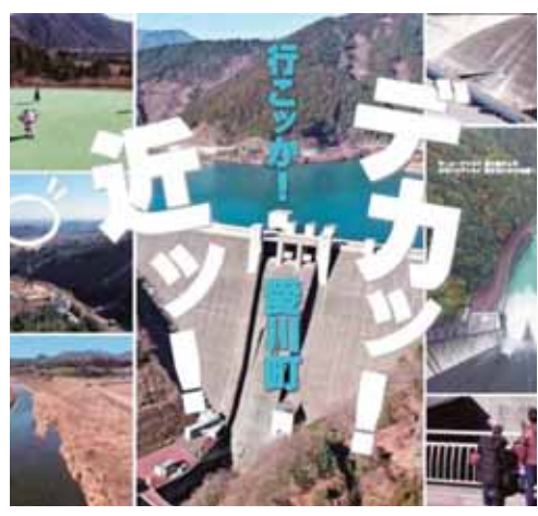
町の新しいPR動画ホームページで公開中

また、お米についても、調達先の神奈川県学校給食会を通じて、極力町内産米を優先的に納入するよう依頼しているところですが、平成29年度からは、県史愛川農協との提携により、町内産の「愛ちゃん米」の使用を積極的に進めていくこととしています。