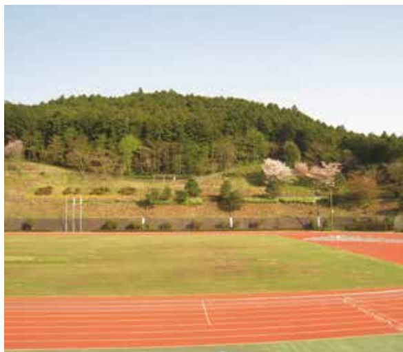
新たにPPSを導入した三増公園

最終日の3月24日には、5会派による討論が行われました。内容の一部を紹介します。