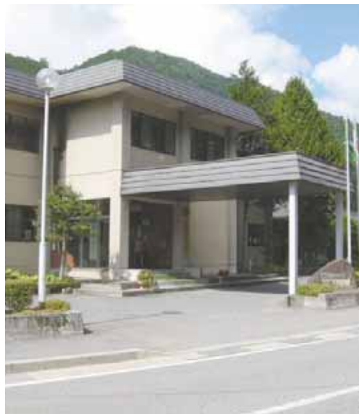
長野県林業大学校

施設で、幼稚園と保育園の機能を併せ持ちます。給付対象や保育の必要性確認のため、市町村の「教育認定・保育認定」が必要となり、保育料決定にも違いがあります。子育て支援課長 町と幼稚園との協議を行い、認可をする県とも具体的な調整を行っていきます。平成30年3月までには設置認可を受け、4月に開所する予定です。