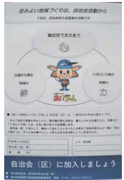
自治会の加入促進チラシ