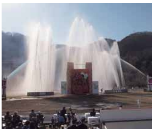
年始に行う消防出初め式