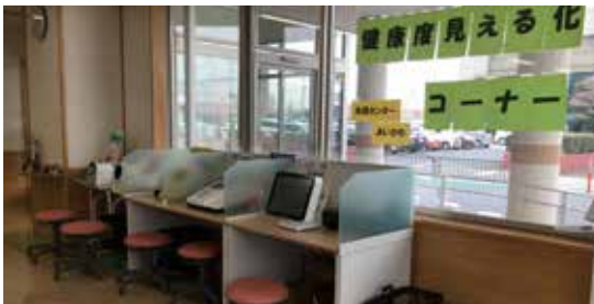
健康づくりの取り組み強化

創業者支援セミナーなどの開催や、新婚生活支援事業の創設、小学3年生から中学3年生までを対象とした土曜寺子屋の支援、未病対策を含めた健康づくりの取り組み強化、日本郵便株式会社と連携した全国初のトータル見守りサポート事業の施行など、さまざまな事業を行い地方創生のさらなる推進に努めていきたいと考えています。