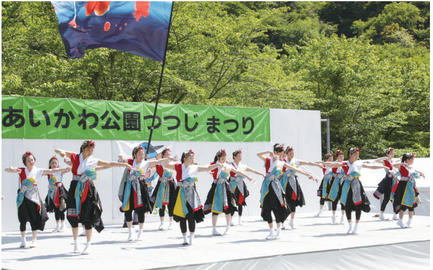
第14回あいかわ公園つつじまつりのステージ