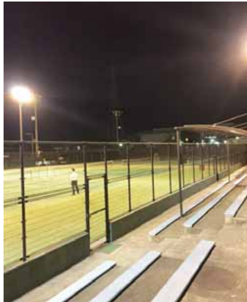
夜間の第一号公園テニスコート

町長 町の活性化を図るうえで観光の果たす役割は大変重要です。町観光協会ホームページの全面的リニューアル、近隣市