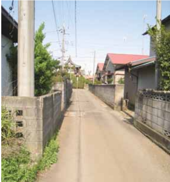
狭あい道路の解消へ向けて

町長 林業は担い手の高齢化が深刻化し人材育成を目的に設置された大学校は平成23年には全国に6校でしたが、現在14校29年度は3校が開設計画です。誘致は先を見据えることが求められ、県などの意向を踏まえることが必要と考えます。