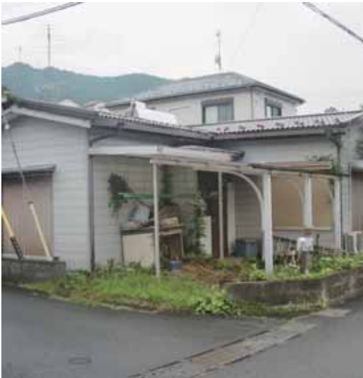
「空き家バンク」に登録されている空き家

区が133棟、高峰地区が48棟、中津地区が135棟となっています。実態調査の結果、軒天の損傷など、手入れが行き届いていない不適正管理の空き家が21棟ありましたが、空き家対策特別措置法に基づく「特定空き家」に該当する物件はありませんでした。〈その他の質問事項〉投票率向上の取り組みについて