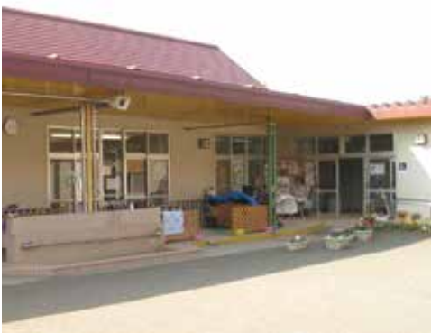
新たに定員枠を拡大した春日台保育園

農林水産業費については、青年就農者や農業従事者に対する各種支援を引き続き実施し、遊休農地では、企業等の参入による先端技術を活用した農業経営の実現に向けた調査・研究を進めることで、有効な利用促進等が図られるよう期待します。