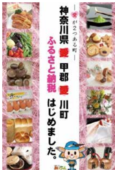
ふるさと納税しやすい工夫を

みらい絆を代表して、意見と要望を交えながら賛成の立場で討論を行います。 町職員の各種研修について、この町を少しでも暮らしやすい、住んでよかったと町民の皆さんに思っていた、ただけるような町にするために、町長と全職員が総力を挙げて運営に邁進していただきたいと考えます。各研修が工夫して行われることで、よい結果が出ることを期待します。 ふるさと納税制度については、町に寄付される額より他の市町村に寄付することで受けられる税控除の額が若干増えているとのこと。そこで、返礼品を一つの箱に詰め合わせるなど、家族が少人数でも寄付しやすくなる工夫をしていただくようお願いいたします。 防災対策費では、防災資機材の備蓄は少しずつ整備されることでした。町民に安心を与えることと評価します。