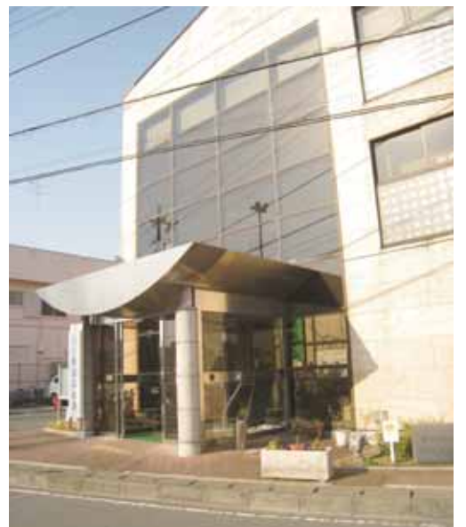
福祉避難所に指定されている中津公民館

はじめ、防災マップの町ホームページへの掲載のほか、3施設の入り口付近に福祉避難所であることを示す看板をそれぞれ設置し、周知を図っていきます。引き続き、町ホームページや広報紙、各種訓練などを活用し、福祉避難所の位置や役割、利用可能な対象者などの周知に鋭意努めていきたいと考えています。