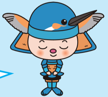
あいちゃん©愛川町

Patuyuin ang mga sanga / nahulog na dahon / ginupit na damo bago itapon sa araw ng "Resource C (Yard)".