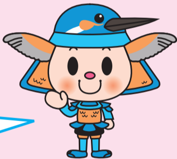
あいちゃん

Ang papel ay isang importanteng resource! Paghilwa-hiwalayin ito mabuti at itapon bilang "recyclables" at hindi bilang "combustible waste".