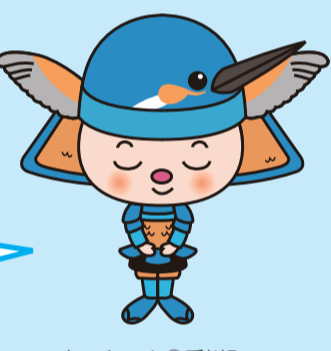
あいちちゃん

ចំពោះមែកឈើដែលកាត់ចោល ស្លឹកឈើជ្រុះ ស្មៅកាត់ចោល សូម សម្របសម្រួលចោលនៅថ្ងៃចន្ទ-ចន្ទាន (មែកឈើ)។ ឡេក