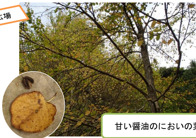
甘い醤油のにおいの葉、カツラの木

途中にある「あおぞら館」の掲示物は、サークル愛川自然観察会が季節ごとに更新しています。