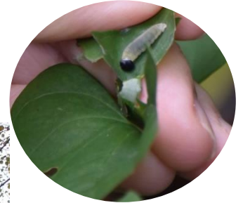
葉を丸くして中に虫が隠れている