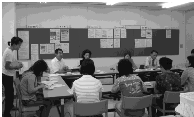
7月10日 井戸端会議の様子